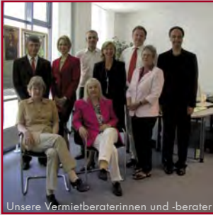
Unsere Vermietberaterinnen und -berater